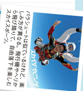
パラグライダーは仰いでいるけれど、乗り方が異なる。飛行機やヘリコプターから降りて、自由落下を楽しむスカイスポーツ。